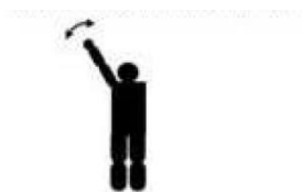
Figura 1 Richiedo assistenza: