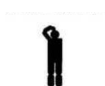
Figura 2 Non richiedo assistenza, sono ok